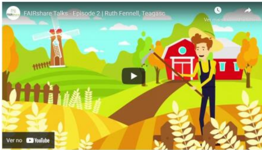
1 - #FAIRshare talks