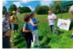
Round table for biodiversity Landahut