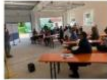
InnoTourBayern Station Field Robotics