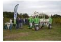
Vignoble 2.0 – new technologies in viticulture