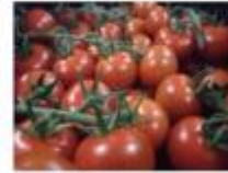
LED light test in tomato glass house winter production