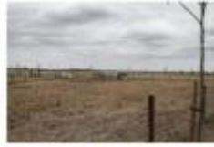
P'Orchard – free-range pigs in agroforestry